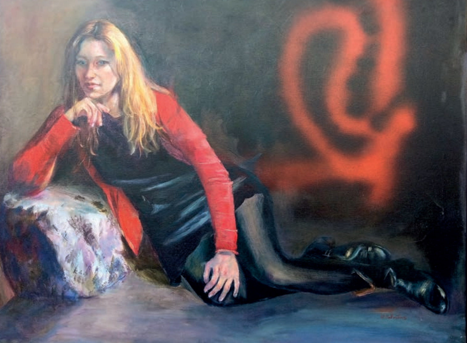
Rojo Negro. Óleo/lienzo. 89x116