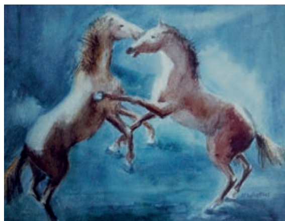
En la Alpujarra almeriense. Acuarela. 33x41